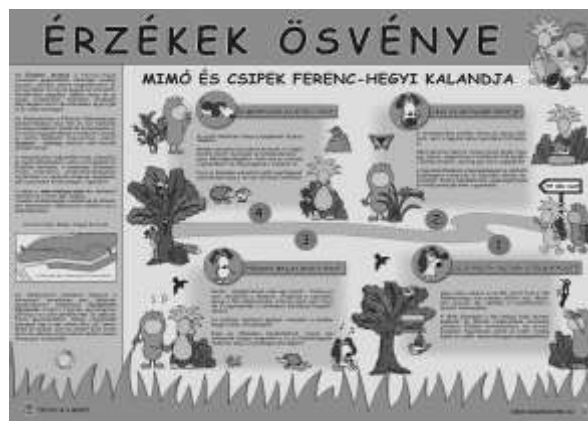
5. ábra: Az Élményösvény nyitótáblája

A Környezetvédelmi Minisztérium Zöld Forrás pályázata 2013-ban tette lehetővé a szintén hiánypótló „Élményösvény” létrejöttét (nyitótábla képe az 5. ábrán található). A gyermekek igényei szerint kialakított természetismereti tanösvény célja a helyi természeti értékek megismertetése és bemutatása kiemelve a növénytani és állattani látnivalókat. A Ferenc hegyen kialakításra került terület óvodás és kisiskolás korosztálynak biztosít élményszerű természetjárást; a pedagógusoknak szemléltetési lehetőséget ( www.mimoescsipek.hu/elmenyosveny ).