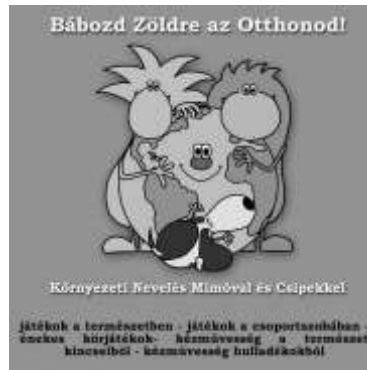
4. ábra: Zöld Játéktár DVD borító

A Környezetvédelmi Minisztérium Zöld Forrás pályázata 2013-ban tette lehetővé a szintén hiánypótló „Élményösvény” létrejöttét (nyitótábla képe az 5. ábrán található). A gyermekek igényei szerint kialakított természetismereti tanösvény célja a helyi természeti értékek megismertetése és bemutatása kiemelve a növénytani és állattani látnivalókat. A Ferenc hegyen kialakításra került terület óvodás és kisiskolás korosztálynak biztosít élményszerű természetjárást; a pedagógusoknak szemléltetési lehetőséget ( www.mimoescsipek.hu/elmenyosveny ).