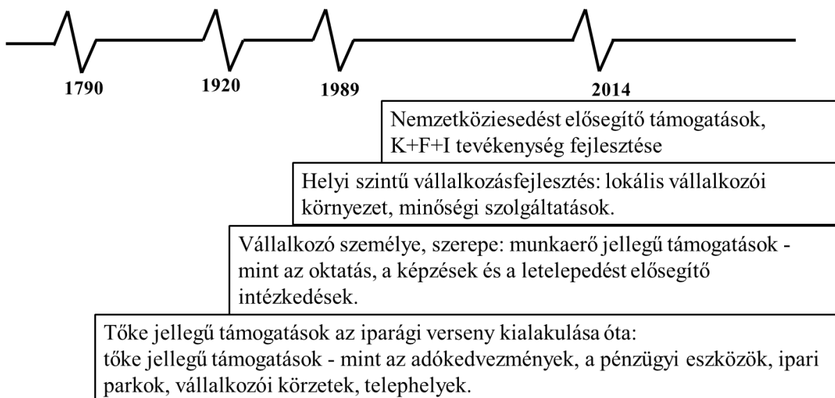
1. ábra: Vállalkozásfejlesztés súlypontjainak megjelenése a gazdaságfejlesztésen belül

Összefoglalva az előzőeket, a vállalkozásfejlesztés kialakulása történelmileg levezethető. A gazdaságfejlesztésben megjelenő vállalkozásfejlesztésben különböző súlypontok rajzolódnak ki. Ezek a tőke jellegű támogatások: az adókedvezmények, a pénzügyi eszközök, ipari parkok, vállalkozói körzetek, telephelyek kialakítása; a munkaerő jellegű támogatások: az oktatás, a képzések és a letelepedést elősegítő intézkedések; a környezetet érintő támogatások: a városi funkciók és a szolgáltatások; végül a szélesebb gazdasági környezetet fejlesztő szolgáltatások: a nemzetköziesedést elősegítő intézkedések, a felsőoktatás fejlesztése és a K+F tevékenységek. Ezt foglalja össze az 1. ábra. A vállalkozásfejlesztés kialakulásában megfigyelhető a területi dimenzió. Ez azt jelenti, hogy a lokális szinten irányított fejlesztési tevékenységeknek egyre nagyobb szerepe van.