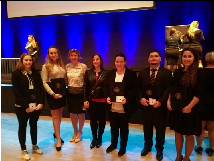
MNB díjátadó ünnepség 2018.11.15.